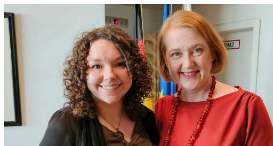
Spotkanie z niemiecką Ministrami Rodziny, Seniorów, Kobiet i Młodzieży Panią Lisą Paus, kwiecień 2024