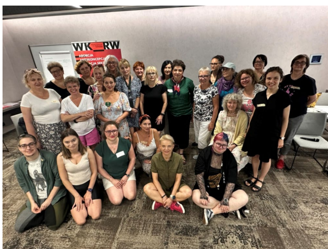
Zjazd WKRW w Warszawie, czerwiec 2024 r.

Ponadto, reprezentantki organizacji koalicyjnych uczestniczyły w szkoleniu online z reagowania na molestowanie w przestrzeni publicznej oraz w warsztatach samoobrony i asertywności metodą WenDo.