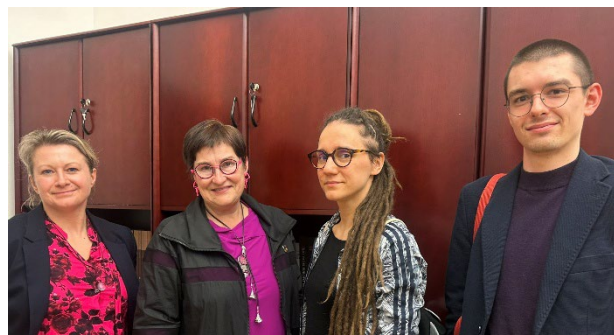
Spotkanie z Petrą Bayr, Sprawozdawczynią Rady Europy ds. raportu „Ochrona obrończyń praw człowieka i osób broniących praw kobiet w Europie”, marzec 2024