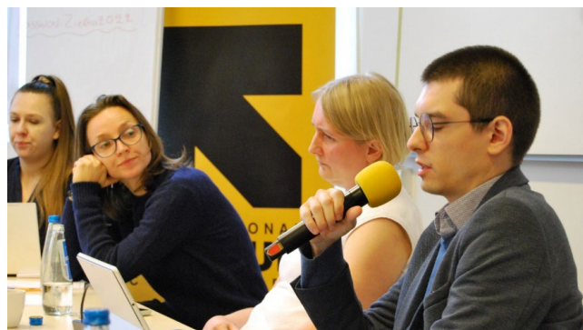
Konferencja na temat reformy prawnej dotyczącej zmiany definicji zgwałcenia organizowana przez Biuro Krajowe Światowej Organizacji Zdrowia w Polsce, grudzień 2024