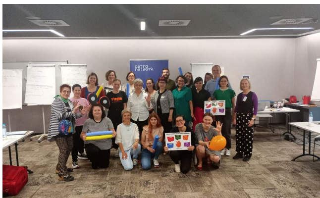
Zjazd sieci ASTRA w Warszawie, maj 2024 r.

W maju w Warszawie odbył się coroczny zjazd sieci. Spotkania poświęcone były podsumowaniu działań, planowaniu strategicznym oraz wzmocnieniu współpracy między organizacjami członkowskimi.