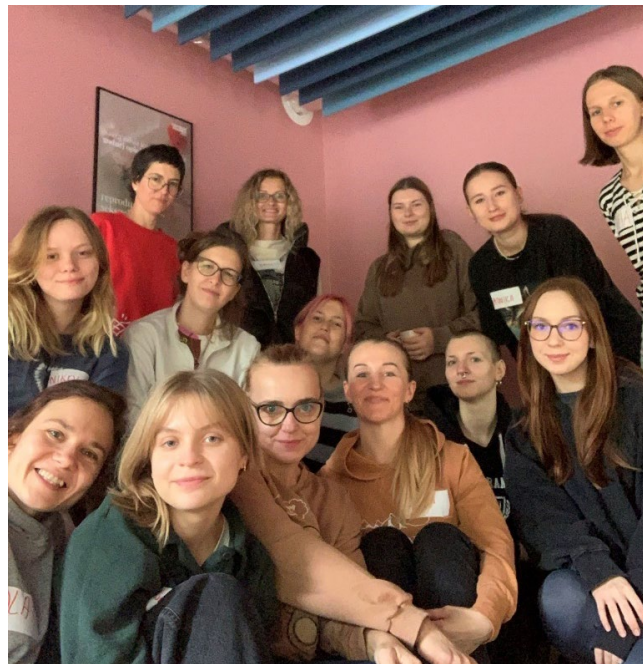
Trenerki i uczestniczki podczas warsztatów WenDo w Centrum Zdrowia FEDERA w Warszawie, październik 2024

W 2024 roku zorganizowałyśmy kolejną edycję bezpłatnych warsztatów asertywności i samoobrony dla kobiet i osób socjalizowanych do roli kobiecej metodą WenDo, w ramach której odbyły się cztery dwunastogodzinne warsztaty naborem. Ponadto, nasze trenerki przeprowadziły cztery warsztaty zamknięte – dla pra i wolontariuszek FEDERY, dla członkiń Wielkiej Koalicji za Równością i Wyborem oraz dla zespołu organizacji CARE International in Poland.