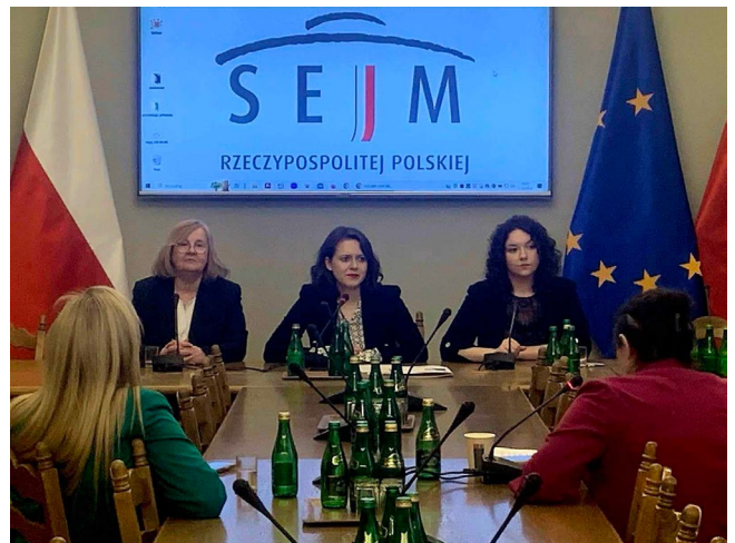
Spotkanie z posłami i posłankami Polski 2050 w marcu 2024r.