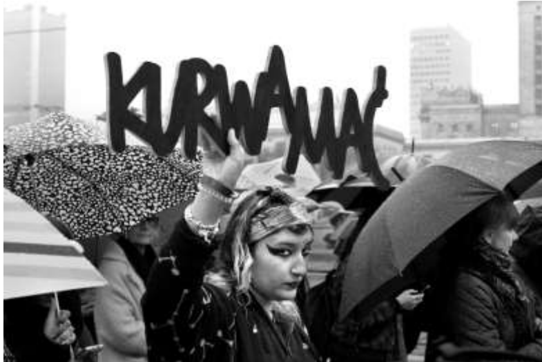
Zdjęcie wyróżnione przez jury/Autor: Radosław Wojnar.