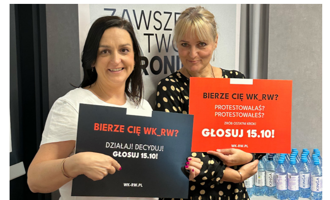
Przykład kampanii „Bierze Cię WK_RW?”, październik 2023 r.