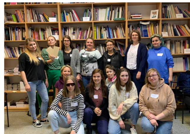
Warsztaty WENDO w siedzibie Fundacji,