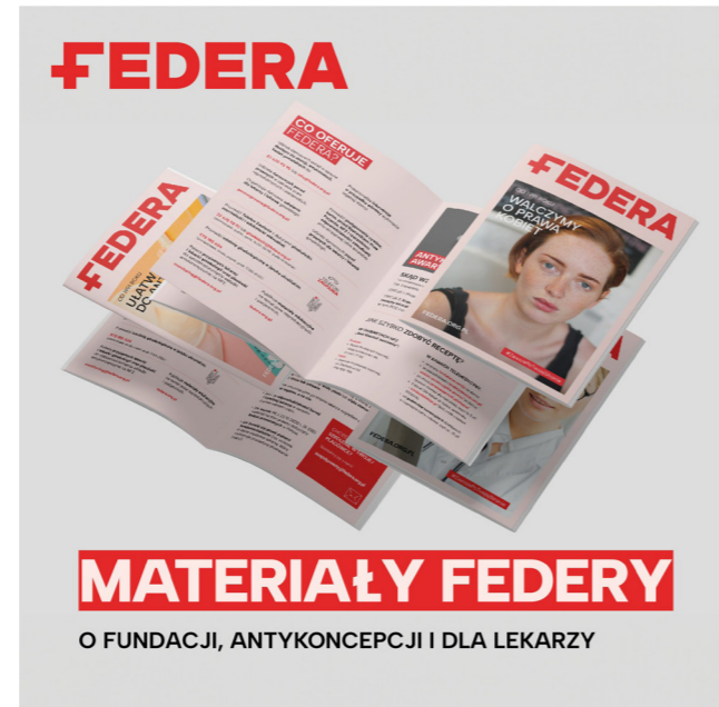
Post prezentujący materiały drukowane Fundacji, listopad 2023