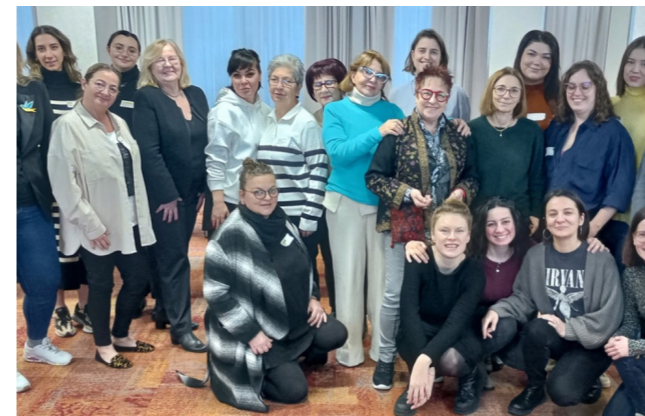
Zjazd organizacji członkowskich, grudzień 2023 r.

Jak co roku, ASTRA prowadziła dokładny monitoring stanu praw seksualnych i reprodukcyjnych w Europie Środkowo-Wschodniej i Azji Środkowej. Biuletyn podsumowywał zebrane wiadomości i pozostał ważnym źródłem informacji w zakresie praw i zdrowia seksualnych i reprodukcyjnych w regionie dla ponad trzech tysięcy subskrybentów oraz obserwujących w mediach społecznościowych. Informacje zawarte w biuletynie były cytowane między innymi przez Center for Reproductive Rights czy International Campaign for Women’s Right to Safe Abortion.