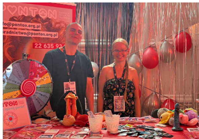
Grupa PONTON na Open'er Festival, lipiec 2023 r.