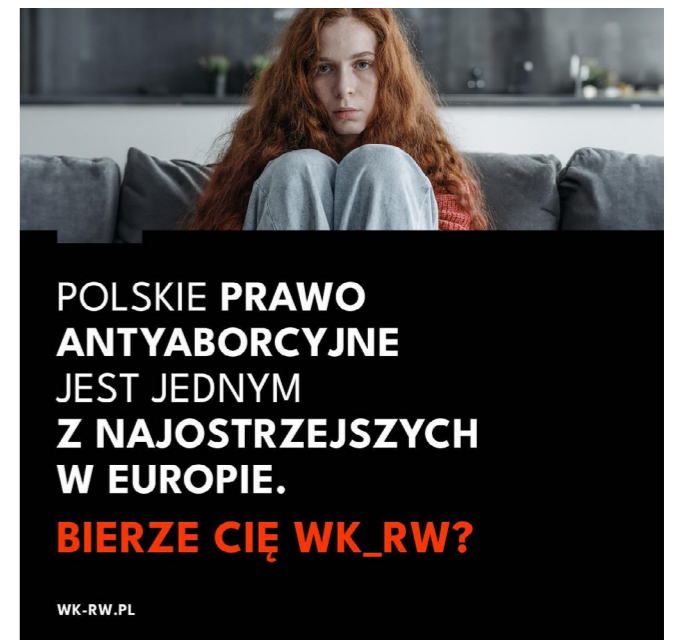
Przykład kampanii „Bierze Cię WK_RW?”, październik 2023 r.