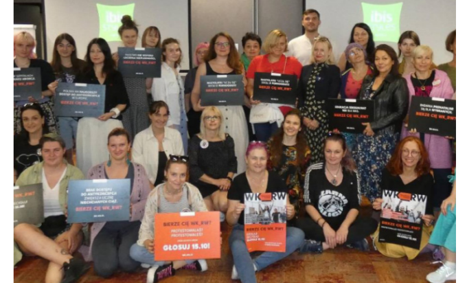
V Zjazd Wielkiej Koalicji za Równością i Wyborem, wrzesień 2023 r.