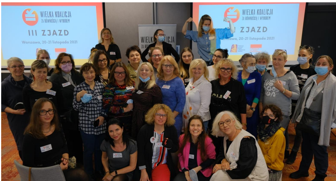
Uczestniczki i uczestnicy III Zjazdu organizacji członkowskich WKRW (20/11/2021).