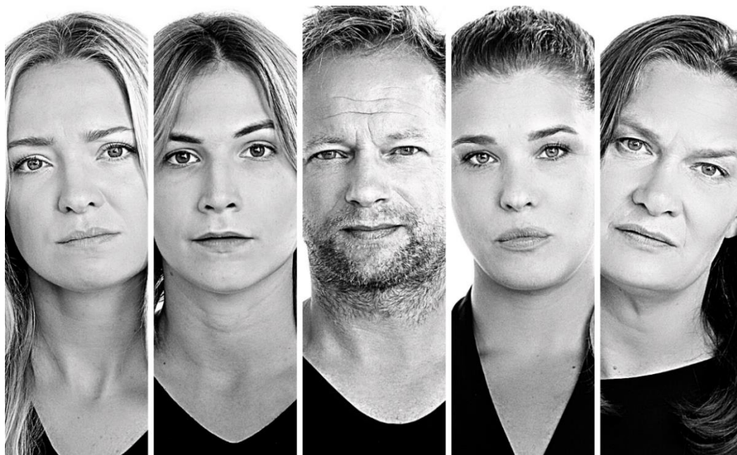
Aktorki i aktor występujący w kampanii Federacji HISTORIE KOBIET #WybórNieZakaz.